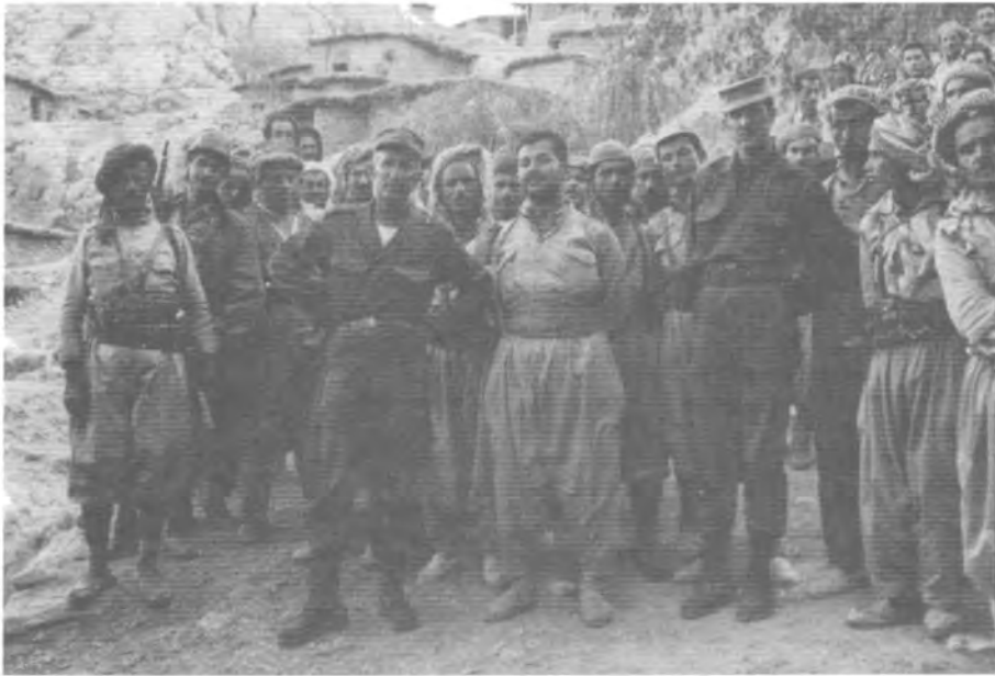
دیه کی کوردستانی ئیران له گه‌ل چه‌ند ئه‌فسه‌ریکی ئیرانی - ته‌موزی ۱۹۶۴